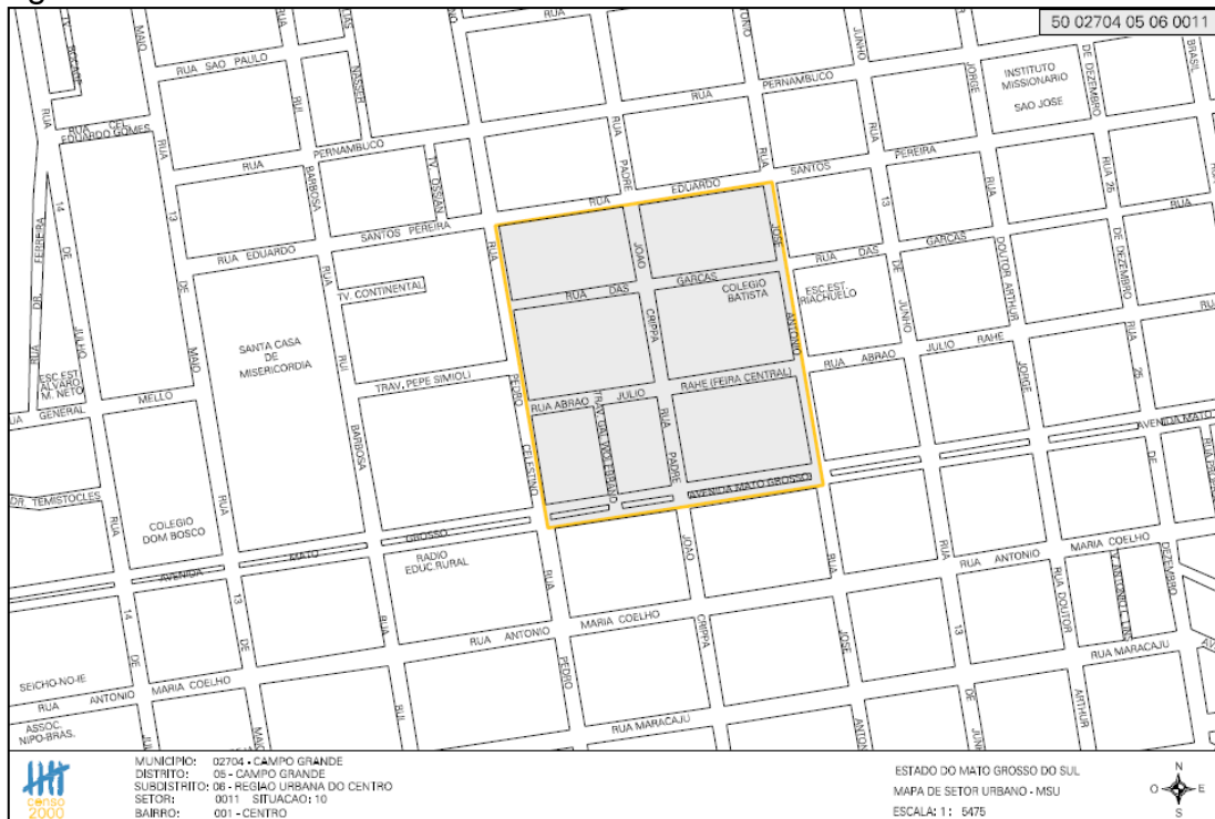
Figura 2 - Setor censitário incluído no estudo.

A primeira casa de cada setor censitário pesquisado foi escolhida por sorteio e as subseqüentes em intervalos proporcionais ao número de habitantes e pessoas necessárias para compor a amostra daquela região (Figura 2).